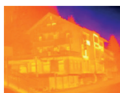
Wärmebild ohne testo ScaleAssist

Da Temperaturskala und Farbgebung von Wärmebildern individuell angepasst werden können, ist es möglich, dass z. B. das wärmetechnische Verhalten eines Gebäudes falsch interpretiert wird. Die Funktion testo ScaleAssist löst dieses Problem, indem sie die Farbverteilung der Skala an die Innen- und Außentemperatur des Messobjektes sowie an deren Differenz anpasst. Dies sorgt für objektiv vergleichbare und fehlerfreie Wärmebilder.